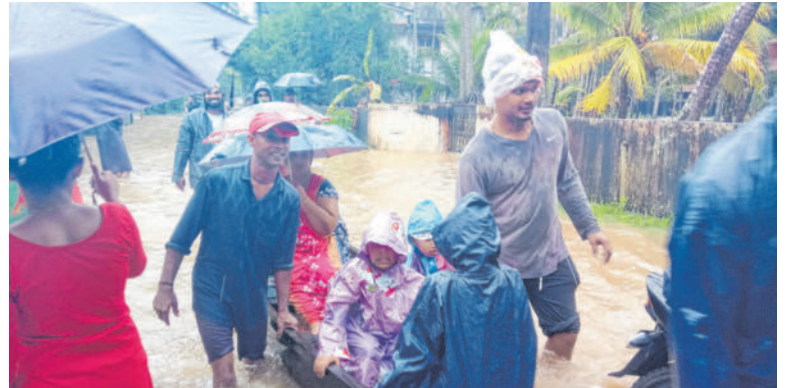
Überschwemmungen kommen in der Regenzeit hin und wieder vor. In diesem Jahr regnete es aber außergewöhnlich lange.